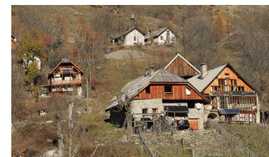
Randonnée à Dormillouse